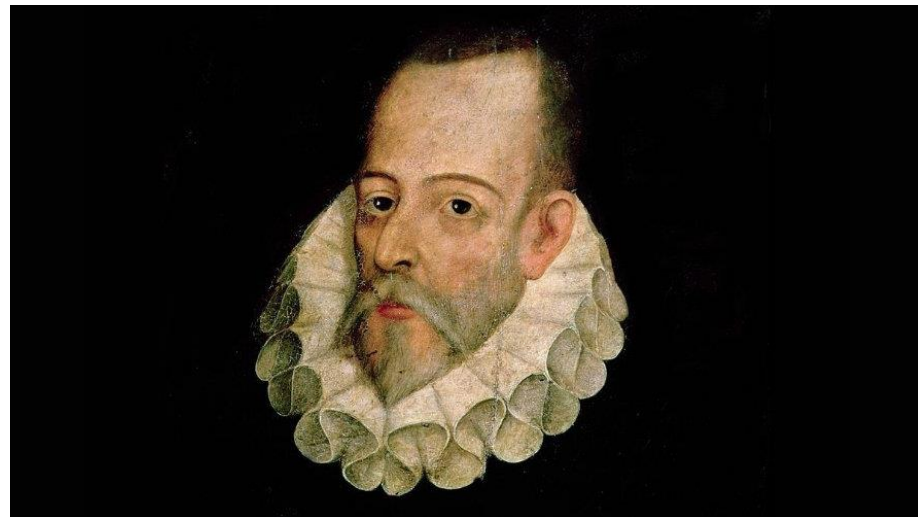
Miguel de Cervantes Saavedra

Además, debe presentar otra herida, más grave, recibida en el pecho por proyectil de arcabuz. «Los huesos de la caja torácica sufrirían por el impacto. Las marcas dejadas por la lesión, junto con la cauterización y posibles restos microscópicos de metal confirmarían la identidad», argumenta el historiador, que dirige el proyecto